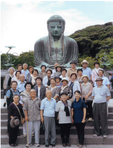
鎌倉大仏殿高徳院

様では、関東一と言われている一木造の大きな木造の観音様の前でたくさんの方からご祈りをいただき、また鎌倉の長谷寺にやはり「十一面観世音」様をお参りをさせていただきました。修復のなった鎌倉の大仏さん、皆さん懐かしい修学旅行を思い出すかのようににぎやかに、また嬉しく有り難くお祈りをさせて頂き、それぞれの場所で記念撮影をいたしました。