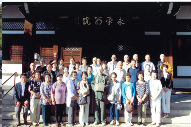
大本山永平寺別院 『長谷寺』

今回の観音講の旅行は9月6日から9月8日まで東京・横浜・鎌倉方面に2泊3日で行きました。 特に長泉寺でお祈りをしております「十一面観世音」様にちなみ東京麻布にあります大本山永平寺別院長谷寺